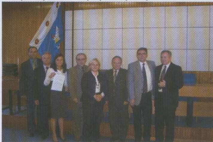
Na zdjęciu: Uczestnicy projektu po podpisaniu umowy.

Zakres projektu obejmuje min. zakup witaczy, tablic informacyjnych, tablic wjazdowych do gmin, tablic z oznakowaniami zabytków, zakup namiotów i inne gadzety promocyjne. Projekt ubiega się o wsparcie finansowe z Europejskiego Funduszu Rozwoju Regionalnego (dofinansowanie w wysokości do 75% całkowitych kosztów projektu) Całkowity koszt projektu to 1 545 tys zł z czego zakres Gminy Cedry Wielkie obejmuje kwotę 198 tys zł.