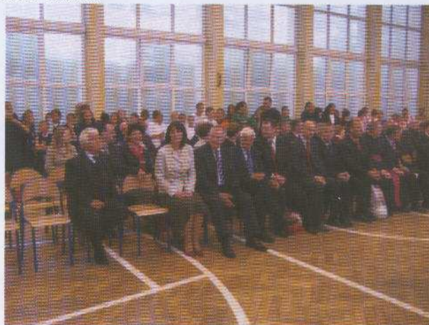
Na zdjęciu : Zaproszeni na uroczystość otwarcia Orlika goście.