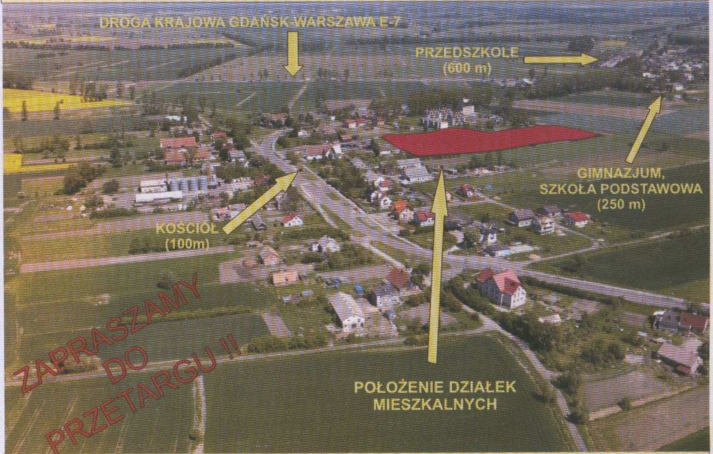
POŁOŻENIE DZIAŁEK MIESZKALNYCH

Wójt Gminy Cedry Wielkie ogłasza II przetarg ustny nieograniczony na sprzedaż działek niezabudowanych, położonych w gminie Cedry Wielkie przeznaczonych w miejscowym planie zagospodarowania przestrzennego pod budownictwo mieszkaniowe jednorodzinne z dopuszczalną funkcją: zabudowy usługowej z zakresu handlu, gastronomii, obsługi rekreacji, kultury, oświaty i wychowania, służby zdrowia i opieki społecznej, rzemiosła towarzyszącego funkcji mieszkaniowej, zabudowy gospodarczej. Działki uzbrojone są w przyłącza sieci wodociągowej i kanalizacji sanitarnej w postaci studzienek znajdujących się na każdej z działek. Droga dojazdowa do działek jest utwardzona. W trakcie realizacji jest budowa sieci energetycznej (na każdej z działek będzie zlokalizowana szafka pomiarowa ZK). Uwaga: Do wylicytowanej ceny zostanie doliczony podatek VAT w wysokości 22% Przedmiotowe nieruchomości są wolne od wszelkich obciążeń i praw osób trzecich. Minimalna wysokość postąpienia wyniesie 1% ceny wywoławczej nieruchomości. Przetarg odbędzie się w dniu 28.10.2009r. o godzinie 10.00, w sali posiedzeń Urzędu Gminy w Cedrach Wielkich, ul. Krasickiego 16. Warunkiem wzięcia udziału w przetargu jest wpłacenie wadium w wysokości 10% ceny wywoławczej (z podaniem numeru działki na przelew) przelewem do dnia 23.10.2009r. na konto Urzędu Gminy Cedry Wielkie nr 118335 0003 02000 114 2000 0019 w Banku Spółdzielczym Pruszcz Gdański o/ Cedry Wielkie