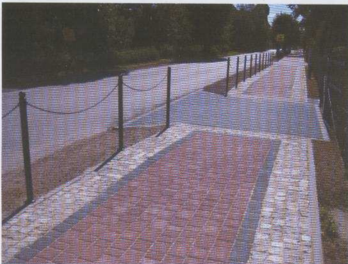
Na zdjęciu: Chodnik przy ul. Osadników Wojskowych

Dzięki pozytywnej decyzji Starosty Gdańskiego, który wyasygnował dodatkowe środki w wysokości 138 tys złotych możliwe było rozpoczęcie realizacji drugiego etapu budowy chodnika w Cedrach Wielkich - tj. 624 mb od budynku ŻOKiS do ulicy Kwiatowej. Wykonawcą drugiego etapu robót jest firma „ARAT” ze Staniszewa koło Kartuz. Całkowity koszt II etapu to kwota 309.028, zł., zaś planowany termin ukończenia zadania upływa 15 listopada br.