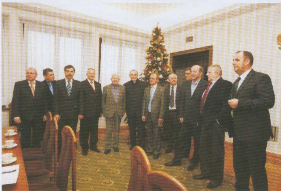
Cedry Wielkie, grudzień 2009 r