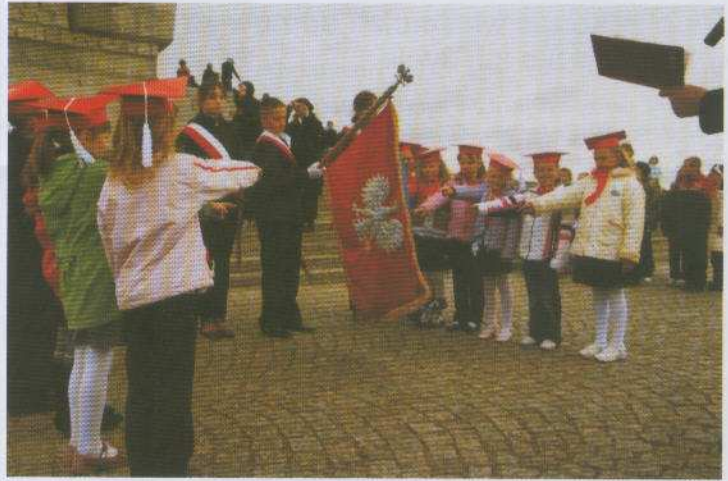
Na zdjęciu: Ślubowanie pierwszoklasistów z S.P.Wocławy.

Po uroczystości ślubowania uczniowie poszczególnych klas, pod pomnikiem Obrońców Westerplatte złożyli kwiaty i zapalili znicze. Następnie wszyscy zwiedzili Twierdzę Wisłoujście. Pomysł uroczystego pasowania uczniów kl. I na Westerplatte szkoła postanowiła wpisać na stałe do kalendarium swoich uroczystości.