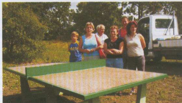
Na zdjęciu: Aktywna grupa mieszkańców Giemlic.

W II etapie projektu zainstalowano na placu zabaw w Koszwałach zestaw zabawowy, huśtawki ważki oraz postawiono ławki. 18 września 2009 r. na rozbudowanym placu odbyło się integracyjne spotkanie w którym wzięły udział dzieci wraz z rodzicami i opiekunami. Łącznie w spotkaniu uczestniczyło 50-ciu mieszkańców, w tym 30 dzieci w różnym wieku. Wszyscy brali udział w konkursach, zabawach i grach.