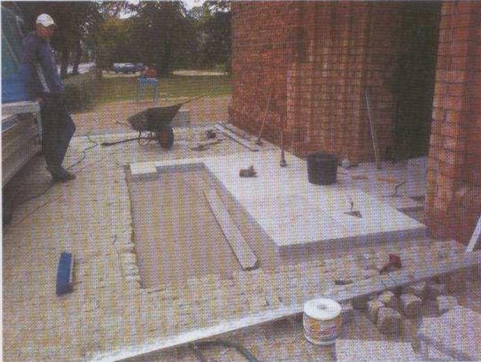
Na zdjęciu: Widok prac w trakcie realizacji.

Na przełomie października i listopada wykonane zostały prace remontowe przed wejściem do kościoła parafialnego w Cedrach Wielkich. Polegały one na ułożeniu płyt granitowych oraz kostki granitowej tuż przed głównym wejściem. Prace zostały wykonane przez firmę TELEELEKTRONIKA - Roboty Drogowe Bogusław Pszczoła z Ciepłewa. Inwestorem przedmiotowego zadania była Parafia w Cedrach Wielkich natomiast Gmina częściowo partycypowała w kosztach tego przedsięwzięcia.