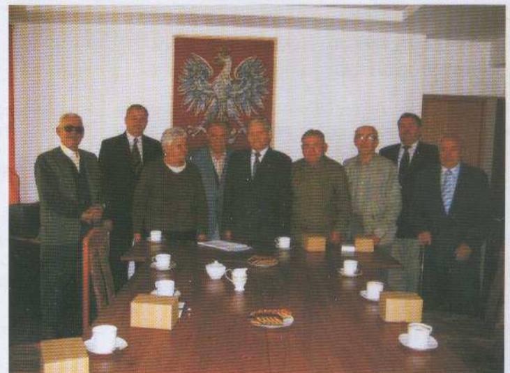
Na zdjęciu: Wójt Gminy w towarzystwie kombatanów.