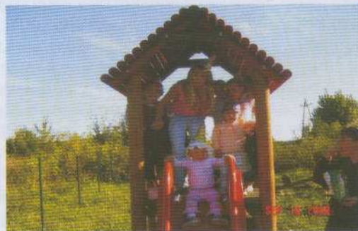
Na zdjęciu: Dzieci na placu zabaw w Miłocinie.