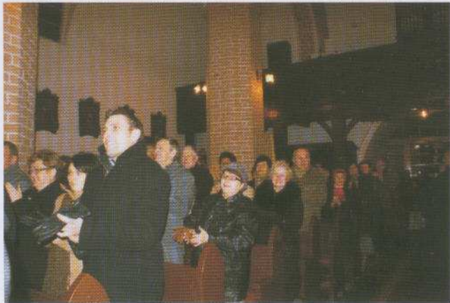
Na zdjęciu: Zgromadzona w kościele publiczność podczas koncertu